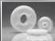
Engineering Plastics 創業以来の卓越した技術力と豊富なデータをもとにベストソリューションをおくり続けるエンプラスギヤ