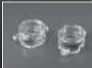
Plastic Optics 独自技術を駆使し、ガラスレンズに代わる性能を実現したプラスチックオプティクス