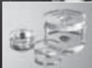
LED 独自の光束制御により薄型化、均一輝度、低消費電力を同時に実現したLED光源用拡散レンズ