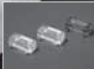
Plastic Optics 家庭に普及し始めた光通信市場向けの最適材料・光学設計によるプラスチックオプティクス