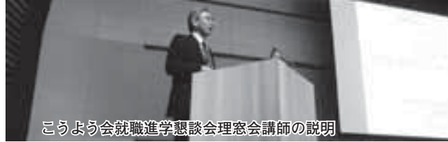
こうよう会就職進学懇談会理窓会講師の説明