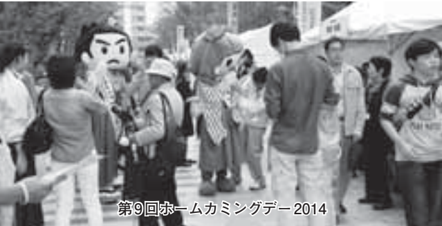
第9回ホームカミングデー2014

7ヶ月におよぶ、企画・制作の準備・運営には卒業生と大学の教職員、こうよう会会員、学生など延べ2,000名の皆様が参加し、親密な交流が一段と進みました。