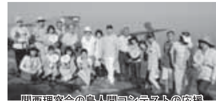
関西理窓会の鳥人間コンテストの応援

80年の歴史のある47都道府県の理窓会支部が親密な小集団によって受け継がれております。それぞれの支部によって、皆さんの活動に工夫が見受けられるようになりました。Facebookやメールの活用等によって日常的な活動が繋がる多極化ネットワークの時代になるでしょう。